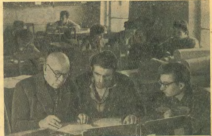
Дипломка ф-та ВиК.